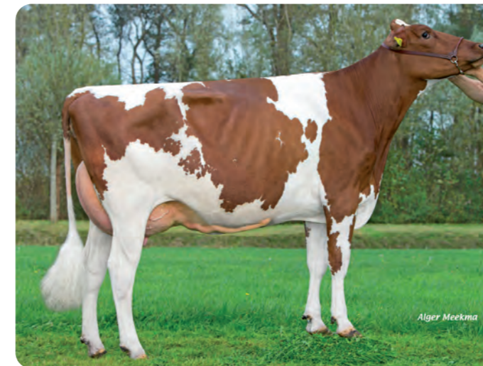
POPPE FIENCHEN 8685 RED (VG-86) Uit de FRESCO RED familie