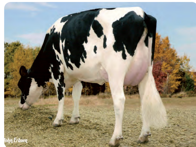
GLEN-D-HAVEN OMAN BIFFY ET (VG-86) De oorsprong van PARTY