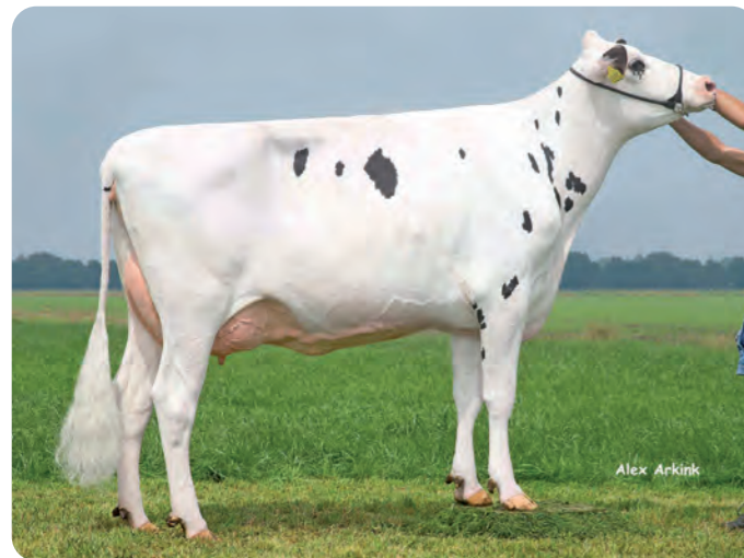
DE WIJDE BLIK DELTA BEA Overgrootmoeder van FENIX