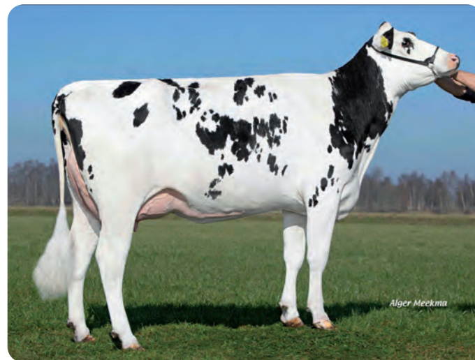
DELTA BELINDA Grootmoeder van FENIX