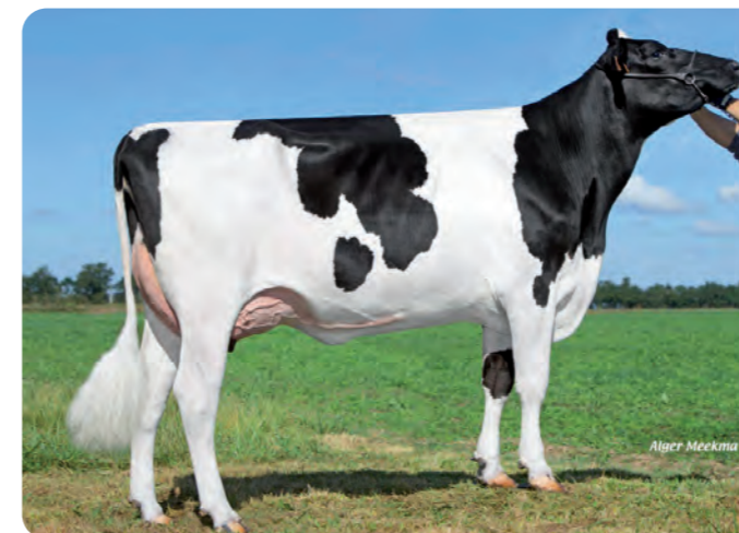
MOZILLA Overgrootmoeder van REX P