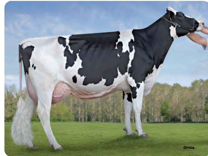
GE-GLEN-D-HAVEN BIFFY PLANE ET (MB-86) De oorsprong van PARTY