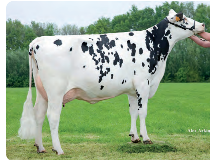
DELTA JARIMA (VG-86) Overgrootmoeder van GENESIS P