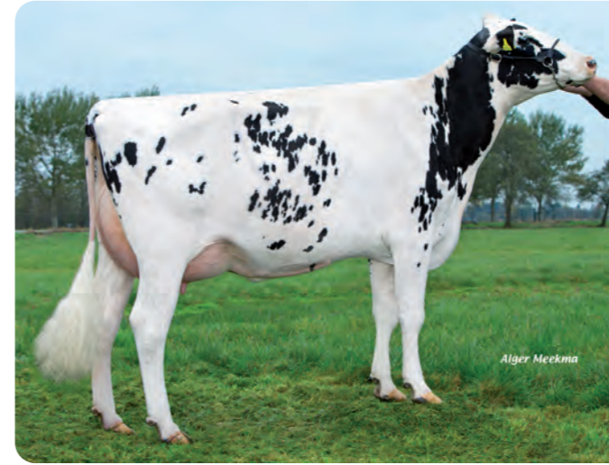
WATERMOLEN SUPERSIRE MARIJKE (VG-87) Grootmoeder van KODAK