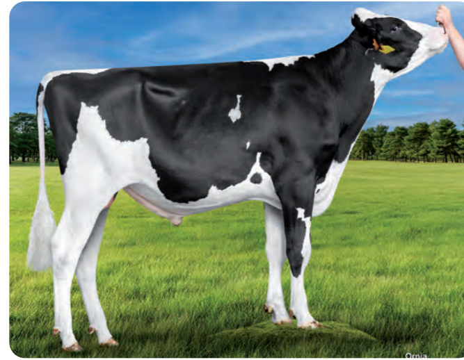
GENER PARTY ET

BLF CVF KI code: 785475 Geboortedatum: 30/10/2022