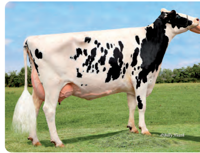
KEVREL SHOTTLE MAY ET (EX-94) Overgrootmoeder van KODAK