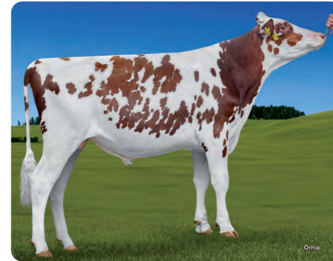
FRESCO GH FIENCHEN RED ET

BLF CVF KI code: 784904 Geboortedatum: 27/09/2021