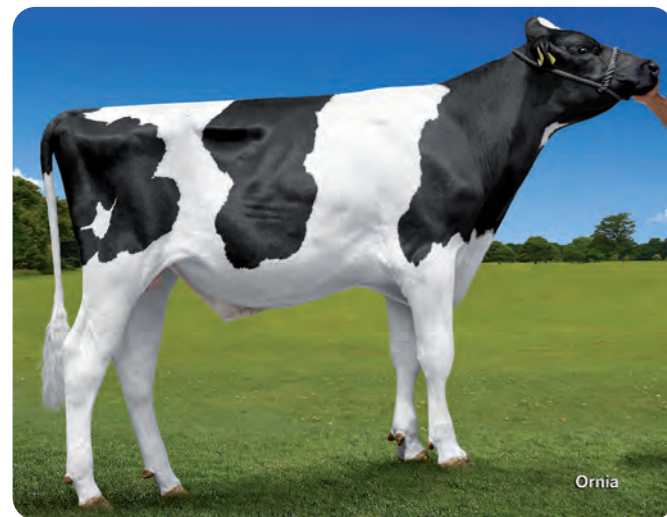
DOLOMITA DELTA JAIDYN ET

BLF CVF KI code: 783452 Geboortedatum: 08/03/2020