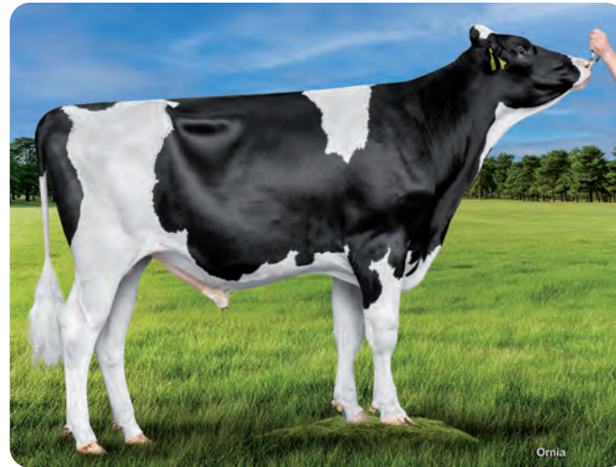
FENIX DELTA BEVERLY ET

BLF CVF KI code: 786143 Geboortedatum: 23/08/2022