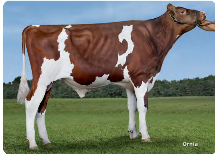
DESIRE ARIZONA POLLED RED ET

DESIRE ARIZONA POLLED RED ET Rueben KG - Lasserg - Münstermaifeld BLF CVF 769941 26/11/2015