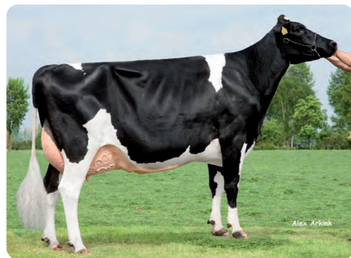
DE BIESHEUVEL JAVINA 19 ET (VG-88) Betovergrootmoeder van DOLOMITA