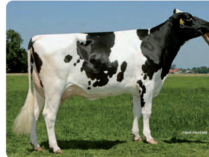
GROENIBO 20 RAMOS JANE (VG-86) Betovergrootmoeder van GENESIS P