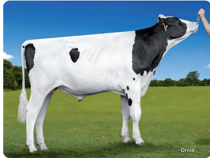
KALENJI CELEBRITY ET