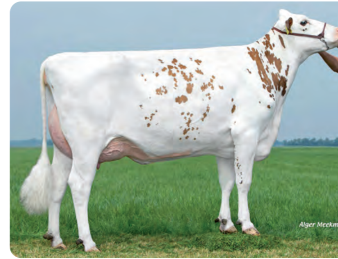
HOANSTER DELTA JOLINA (VG-85) Grootmoeder van GENESIS P

BLF CVF KI code: 784903 Geboortedatum: 18/11/2021