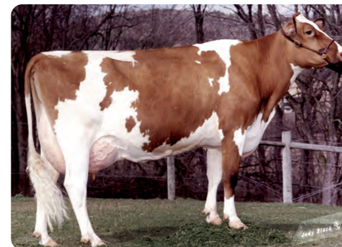
ELITES-JSJ FAC FEEBE-RED (EX-92) De oorsprong van FRESCO RED