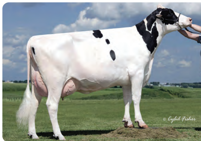
SYNERGY PLANET PIPER ET (EX-91). De oorsprong van SOLUTION P

ESPM9205524118 SOLUTION P GH PUR ET BLF CVF A-11-1149 DE000667990691 Heinrich Weckesser - Stadallendorf 13/01/2023