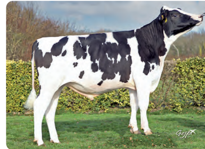
REX P EV

BLF CVF KI code: 785985 Geboortedatum: 03/08/2022