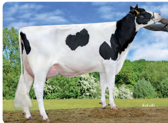
NIKITA (VG-87). Moeder van SANTI

ESPM9204523525 NEMO G SANTI ET BLF CVF 781898 DE000122523969 Rinderzucht Kaack GbR - Mözen 01/07/2017