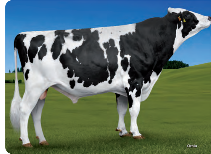
MANDY KODAK ET