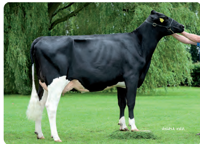
DE BIESHEUVEL JAVINA 50 ET (VG-87) Overgrootmoeder van DOLOMITA